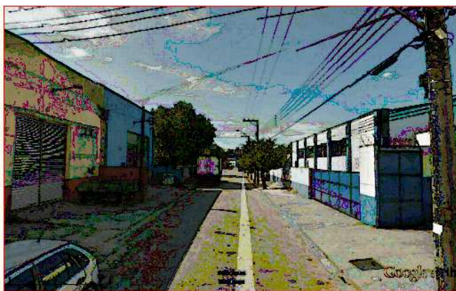
VISTA DA R.ADV.ZEFER.VASCONCELLOS–SENT.LESTE

A via onde está instalada a empresa é uma via de mão dupla, com estacionamento em ambos os lados. Esta via faixa de rolamento de 6,30 metros. A empresa possui contrato de locação de um imóvel, sito à Rua Adv. Zeferino Vasconcelos n.º 588, Lavapés, com capacidade para 20 vagas, conforme cópia do contrato em anexo.