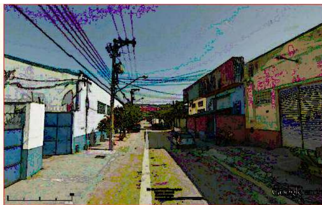
VISTA DA R.ADV.ZEFER.VASCONCELLOS–SENT.OESTE

De acordo com o Manual de Procedimentos para o tratamento de pólos geradores de tráfego – DENATRAN – Dez. 2001, a empresa prestadora de serviços de buffet necessita de 01 vaga/40 m 2 de área computável, ou seja necessita de 06 vagas. De acordo com o Manual de Procedimentos para o tratamento de pólos geradores de tráfego – DENATRAN – Dez. 2001, uma das recomendações de medidas mitigadoras (5.1) traz o seguinte texto: “viabilizar, na parte interna da edificação, os espaços necessários para o estacionamento de veículos, para a carga e descarga de mercadorias, assim como para o embarque e desembarque de passageiros, eliminando as interferências indesejáveis de operações dessa natureza no sistema viário lindeiro ao empreendimento. Para tanto, é importante que, além de observar os parâmetros exigidos na legislação pertinente, os projetos arquitetônicos apresentados para análise sejam discutidos com os respectivos empreendedores e projetistas no tocante à sua funcionalidade e adequação às melhores práticas da engenharia de tráfego”;